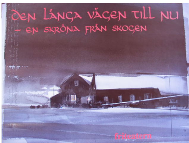
Affisch: Föreställning "Den långa vägen till nu" - en skräna från skogen .