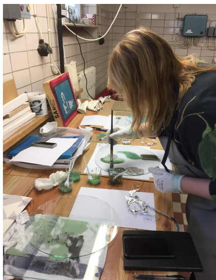
Foto: Föreningen Glasverkstaden i Borlänge - Kurser Glasverkstaden i Borlänge

Långsiktighet: Föreningen har fått kunskap om vad som behövs för att genomföra kurser, så att på sikt flera kurser kan genomföras också för andra målgrupper, till exempel barn och unga. Fler besöker glasverkstaden och föreningen har genom projektet fått fler medlemmar.