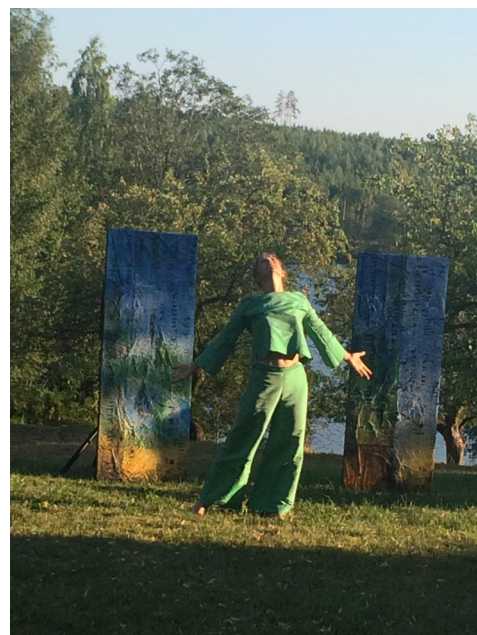
Foto: KORDA Art productions - MÖNSTER att utveckla en Transdisciplinär metod