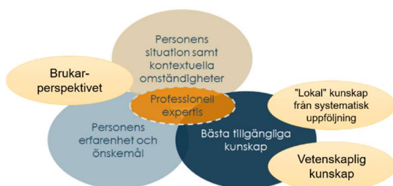
Bild 1. Beståndsdelarna i en evidensbaserad praktik (EBP). Bild modifierad från illustration på Kunskapsguiden 1 .

”Evidensbaserad praktik handlar om att medvetet och systematiskt sträva efter att bygga vård och omsorg enligt bästa tillgängliga kunskap. Den professionelle väger samman sin expertis med bästa tillgängliga kunskap, den enskildes situation, erfarenheter och önskemål vid beslut om insatser.”