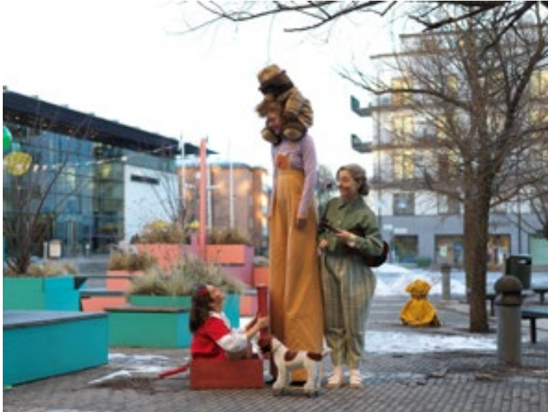
Fotograf Alex Hinchcliffe