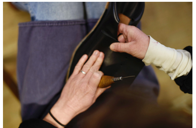
Process mot sandalsydd prototyp